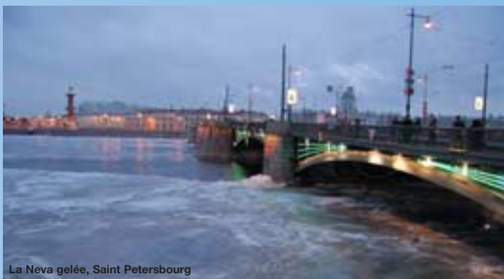
La Neva gelée, Saint Petersburg

Pamela Jouven - HEC pamela@lenversduregard.com www.lenversduregard.com