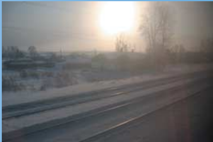
Le paysage qui défile à travers les vitres du Transsibérien

Un désert blanc défile devant mes yeux. Un vide glacial encombré de quelques arbres dénudés. Et puis, le temps d'un battement de cils, un village surgit et s'évanouit aussitôt, emporté par la vitesse de la locomotive. Mais comment font ces habitants pour survivre isolés au plus profond de la Sibérie ? Le regard fixe, je me perds dans des rêveries : le chemin de fer m'apparaît tantôt comme un immense cordon ombilical reliant ce