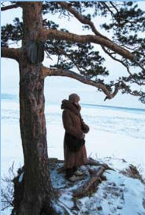
Vue sur le lac Baïkal, Sibérie