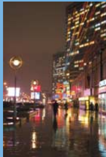
La Novy Arbat, Moscou

presque irréelles et impalpables : est-il vraiment possible que nous nous soyons arrêtés à tous ces endroits, alors que ce voyage en train semble durer depuis une éternité ? Au bout du trajet, Beijing. La foule, les odeurs, les lanternes rouges de l'Empire du Milieu. J'ai toujours voulu aller en Chine. Et pourtant, ce désert blanc emplît mon regard. Encore.